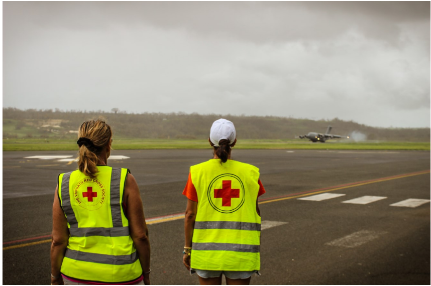
Antap: CEO mo Vice-President blong Vanuatu Red Kros i wet long araevel blong ol rilif saplae long Port Vila (Dickinson Tevi, VRCS); Andanit: Ol Red Kros volentia i lodem ol rilif saplae long Port Vila, Efate (Dickinson Tevi, VRCS)

Vanuatu Red Kros hemi fesem ol jalenj be mifala i mekem sam gudfala ajivmen. Be ril sakes stori blong rikavari ya hemi hao ol pipol blong Vanuatu i strong mo save ko tru long disasta. Wok blong Red Kros hemi posibol tru long komitmen blong ol komuniti we mifala i wok wetem mo hat blong ol man long ol komuniti ya we oli givim taem blong ribild mo rikava. Mi tekem taem ya blong talem tankiu long evriwan long olgeta from patnasip mo peisens blong olgeta. Tugeta bae yumi ko tru long ol jalenj mo rikava.